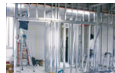
移転後の原状回復工事