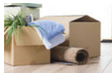
7社の引っ越し作業