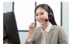
専用回線を用意し店舗のヘルプデスク対応