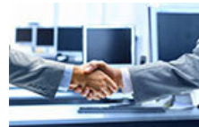
ベンダー様と直接連携