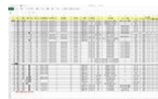
当社センターへ直送、進捗把握とご報告