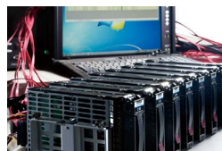
サーバも オンサイト消去