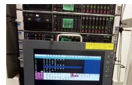
サーバコンソール を SE が操作