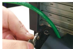
1 台ずつロックを 解除し PC 回収