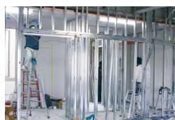
移転後の 原状回復工事