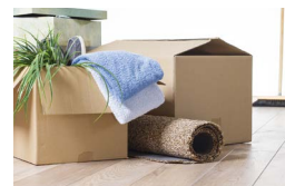
7 社の 引越し作業