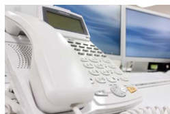
情報機器と 家具・什器回収